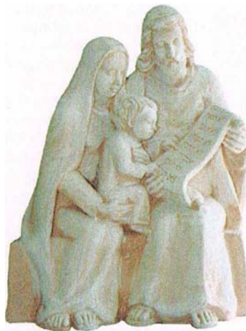
Leto sv. pisma engubirana keramika