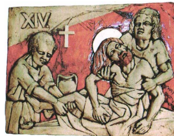
Križev pot engubirana keramika