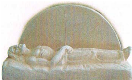
Božji grob terakota